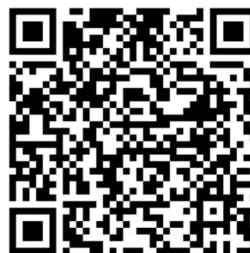
QR-Code Meldeplattform Asiatische Hornisse

Um möglichst rasch Maßnahmen zum Fang der Königinnen und Beseitigung der Nester der Asiatischen Hornisse zu veranlassen, bittet das Ministerium für Umwelt, Klima und Energiewirtschaft um Meldung von Sichtungen in Baden-Württemberg. Dies ist über die Meldeplattform auf der Homepage der Landesanstalt für Umwelt (LUBW), aber auch über die kostenlose „Meine Umwelt-App“ möglich: