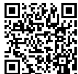
QR-Code Meine Umwelt-App